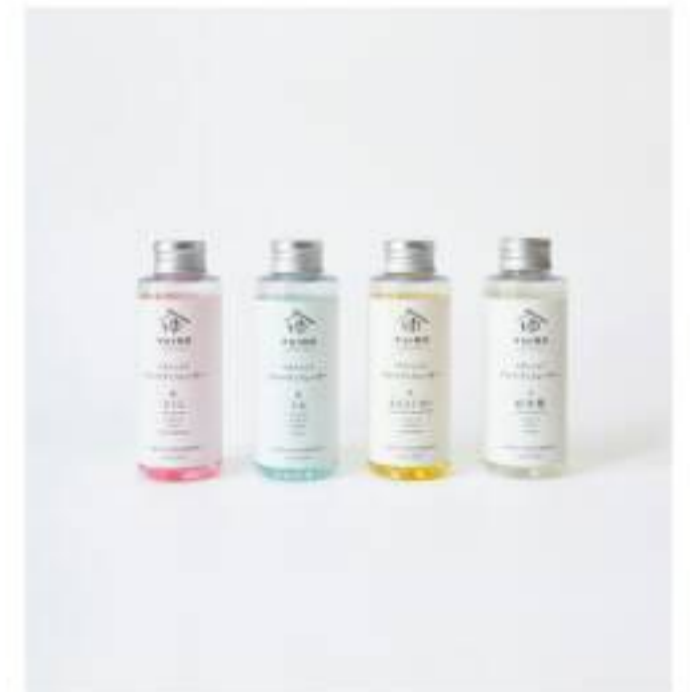
アロマディフューザー 春夏秋冬の自然をモチーフとした日本の香り。