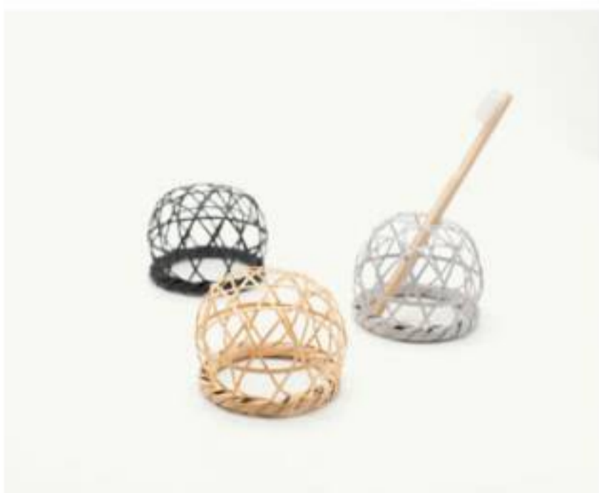
歯刷子スタンド 古くから伊予に伝わる宙編みという伊予竹工芸を用いた歯刷子スタンド

道後温泉は「日本書紀」にも登場する日本最古の温泉。歴史ある温泉の地から伝統ある日本の温泉文化を大切にしながら、新しい色を加えるブランド<YUIRO>の「湯桶」や様々な湯道具をご紹介します