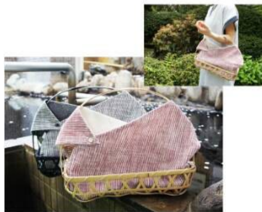
かすり湯かご 伊予竹工芸品。丁寧に編まれる。内袋は綿100%の薄手で丈夫な緋